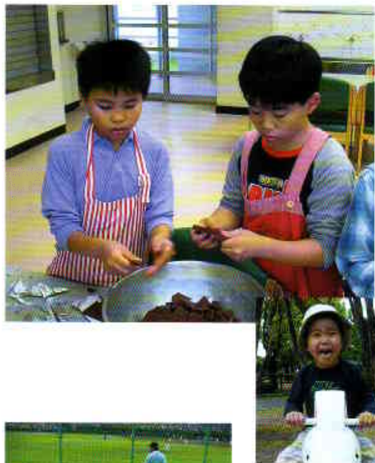
知的障害児施設 豊橋ゆたか学園

初夏の夜、小グループに分かれ夜店とホタル見学に出かけました。ホタルを見るのが初めての子どもたち。暗闇に浮かぶホタルの光に歓声があがりました。近くに飛んできたホタルを捕まえて隣近でホタル観察。「へえ～、こんなに小さいんだ～。お尻が光ってるね～」と興味津々でした。