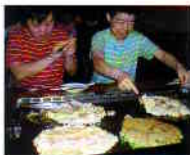
知的障害者支援施設（入所更生） 豊橋ちぎり寮

現在、豊橋ちぎり寮では、73名の利用者さんが生活されています。自立支援法により、「支援」という「サービス」を「商品」として買っていた時代となり、どれだけ利用者さんのニーズに応えることができるかが求められています。